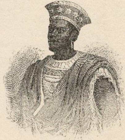
IRA ALDRIDGE AS "OTHELLO."