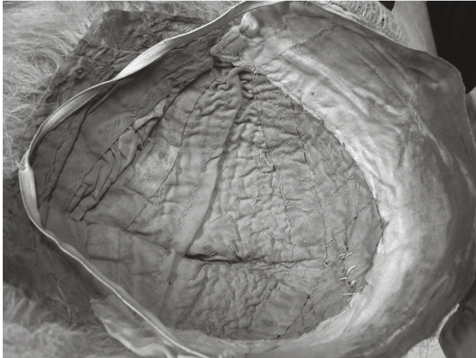
Figure 1 – Face intérieure d’une perruque du XVIII e siècle