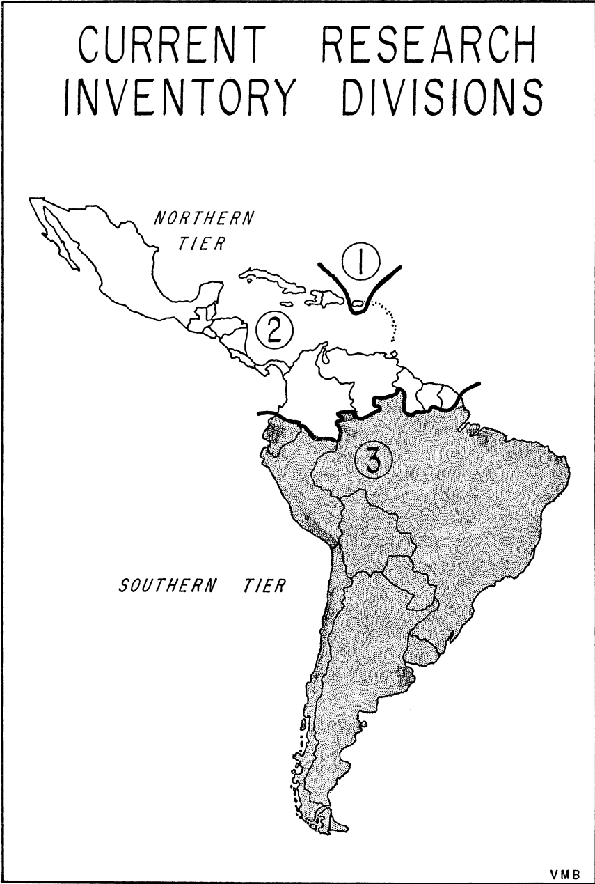
Shaded portion of map designates the area in Latin America surveyed for research projects for this issue of LARR.