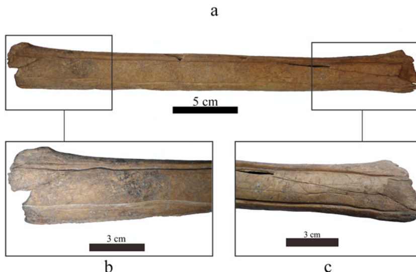
Figura 3. Detalles del ranurado en la cara posterior del tibiotarso de Rhea americana : (a) elemento completo, vista posterior; (b) detalles de la porción proximal de la diáfisis; (c) detalle de la porción distal de la diáfisis.

obtenidas por Buc (2010) y Buc y colaboradores (2010) para marcas producidas por valvas de Diplodon sp. (Buc et al. 2010). En el sitio del cual proviene la pieza se destaca la abundante presencia de Diplodon sp., lo cual, sumado a la ausencia de material lítico, refuerza este análisis en cuanto a considerar el uso de valvas para la realización del surco observado. Futuros estudios