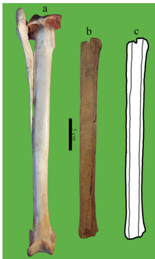
Figura 2. Tibiotarso de Rhea americana : (a) tibiotarso y peroné izquierdos de referencia; (b) diáfisis de tibiotarso recuperado en PV; (c) dibujo del elemento con detalle de los surcos.

Se analizaron las modificaciones de la superficie ósea a ojo desnudo y con lupa de mano de 10x. Entre aquellas producidas por procesos naturales se tuvieron en cuenta la meteorización, marcas de raíces y precipitaciones de óxido de manganeso (Lyman 1994). Respecto a las fracturas, se evaluó el estado del material óseo al momento de fracturación siguiendo los criterios de Outram (2002). También se registraron las incisiones producidas por filos sobre el elemento (Lyman 1994). Una singular marca, dentro de las antrópicas, fue estudiada en detalle en una réplica 1 a través de su observación al microscopio electrónico de barrido (MEB) 2 . Los resultados se compararon con estudios experimentales de otros investigadores (Buc 2010; Buc et al. 2010) para esclarecer la materia prima utilizada como filo. Por último,