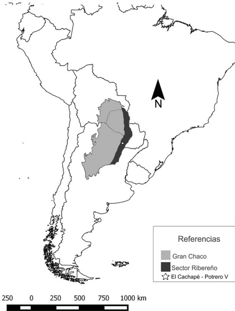
Figura 1. El Gran Chaco sudamericano, sector chaqueño ribereño Paraguay-Paraná, sitio de El Cachapé Potrero V.

espacial preliminar donde se identificaron diferentes sectores (Lamenza et al. 2015). El sector ribereño Paraguay-Paraná (RPP) abarca la margen occidental del sistema hidrográfico Paraguay-Paraná hasta aproximadamente el paralelo 28° de latitud sur (Figura 1). Este sector se adscribe a los grandes humedales sudamericanos (Neiff et al. 1994), situándose dentro de la subregión de esteros, cañadas y selvas de ribera del denominado Chaco húmedo (régimen de precipitaciones entre 1200 y 1400 mm de media anual [Morello y Rodríguez 2009]). Actualmente el clima chaqueño es tropical semiárido a húmedo y las temperaturas oscilan entre los